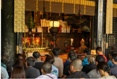
夕座勤行（金峯山寺蔵王堂）

金峯山寺、龍泉寺のほか、金剛峯寺や西禅院など多くの寺院にご協力いただいています。